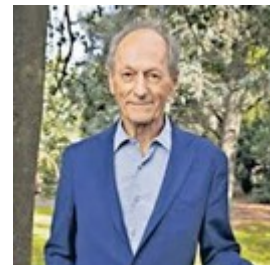
Pr Michael Marmot.

"Faire face aux inégalités de santé en Île-de-France : que nous apprennent les expériences britanniques et québécoises ?"